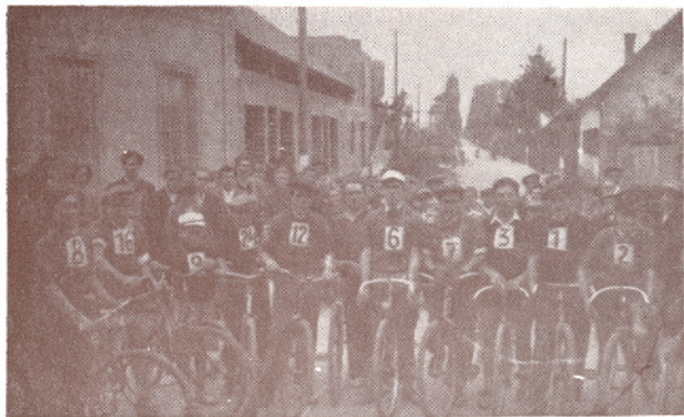
Tekmovalci na jesenskem krosu 1949