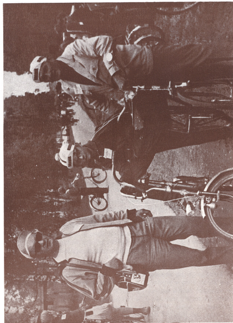
Najmlajši, starejši in še starejši Sreš