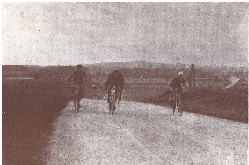
Na pedala! Pred 20 leti po makadamu . . .