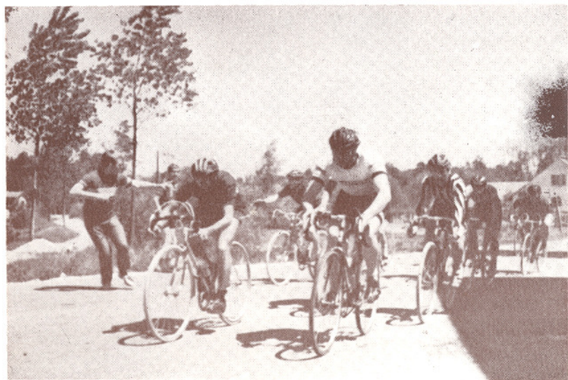
. . . in danes po asfaltu