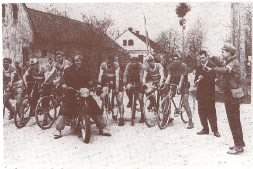
Prvomajska dirka po vaseh občine 1957