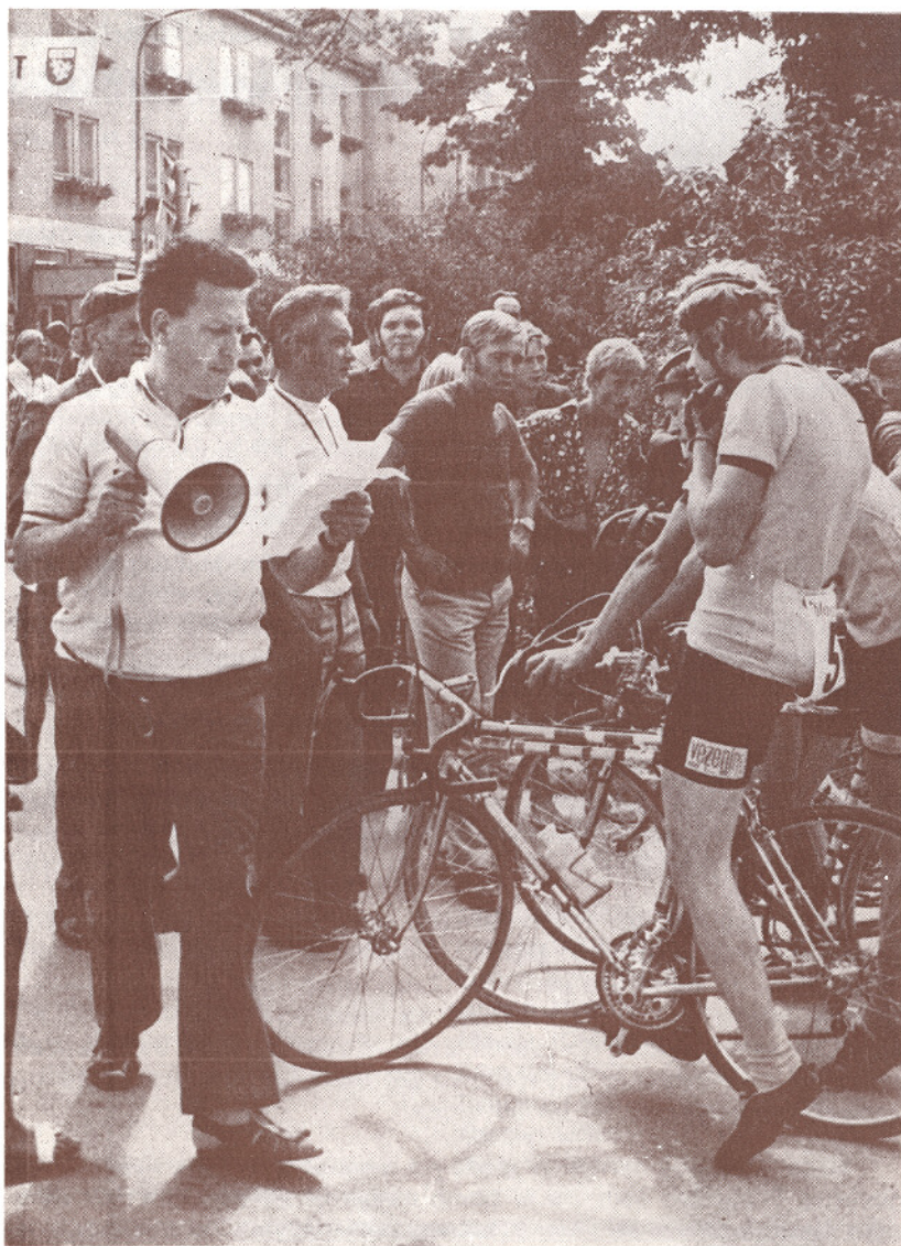
Startna mrzlica pred XVII. dirko »Po Pomurju« v Gornji Radgoni, 1974

dolgoročen ter zahteva mnogo več dela in materialnih sredstev, kot smo jih bili deležni doslej. Danes se predstavljamo torej samo z mlajšimi mladinci in obema kategorijama pionirjev, kar pa naj ne zmanjšuje naših prizadevanj in pomembnosti našega praznika. Koncept dela, ki smo si ga zastavili pred dvema letoma, se postopno uresničuje in že drugo leto bomo imeli starejše mladince, naslednje leto pa svoje predstavnike v vseh kategorijah.