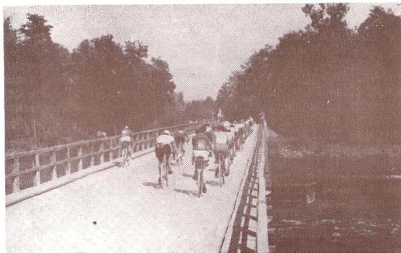
Stari veržejski most, ki je leta 1958 zdržal II. dirko »Po Pomurju«