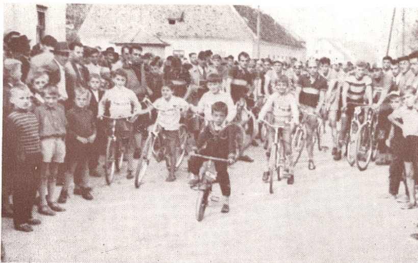
Veliko zanimanje za dirke — nekoč